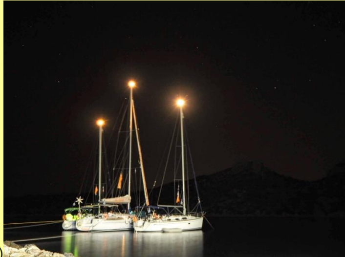
Athene - Angistri (25 zeemijlen)

Zondagochtend varen we weg uit de Griekse hoofdstad. We laten de drukte voor wat het is, en vertrekken naar de prachtige kleine plaatsjes en baaien die in dit gebied te vinden zijn. Op de eerste dag wordt dat een baai op het zuidwestelijke puntje van Angistri. Hier liggen we met lange lijnen naar een boom en een rotsblok een meter of 10 van de kant. Er is hier helemaal niks, behalve één overheerlijk visrestaurantje. Tip: vraag of ze verse tonijn hebben en bestel daar de gegrilde en/of sushi versie van. Tijdens het diner zien we een prachtige zonsondergang met ons jacht op de voorgrond.