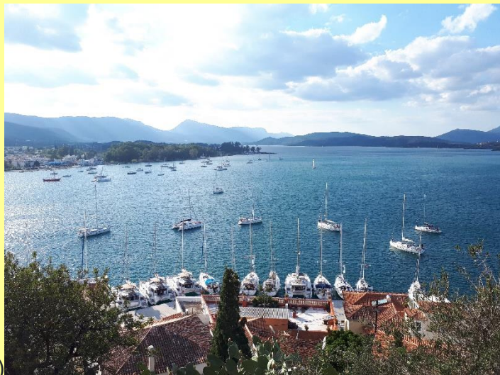
Angistri – Poros (15 zeemijlen)

Zondagochtend varen we weg uit de Griekse hoofdstad. We laten de drukte voor wat het is, en vertrekken naar de prachtige kleine plaatsjes en baaien die in dit gebied te vinden zijn. Op de eerste dag wordt dat een baai op het zuidwestelijke puntje van Angistri. Hier liggen we met lange lijnen naar een boom en een rotsblok een meter of 10 van de kant. Er is hier helemaal niks, behalve één overheerlijk visrestaurantje. Tip: vraag of ze verse tonijn hebben en bestel daar de gegrilde en/of sushi versie van. Tijdens het diner zien we een prachtige zonsondergang met ons jacht op de voorgrond.