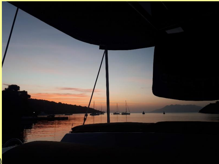
Perdika – Epidavros (15 zeemijlen)

Het volgende eiland dat we gaan ontdekken heet Aegina. We gaan hier niet in het hoofdplaatsje liggen, maar in een wat kleiner en rustiger dorpje aan de zuidkant: Perdika. Dit is een vissersdorpje waar een klein gedeelte van de haven ook diep genoeg is voor zeiljachten. Goed oppassen bij het aanleggen dus. Eenmaal aan de kade is er in dit dorpje vrij weinig te doen. Daardoor is er juist wel extra veel mogelijkheid om te ontspannen. Doordat de haven vrij open is, plons je zo vanaf je jacht in het frisse water en is de zonsondergang opnieuw adembenemend mooi.