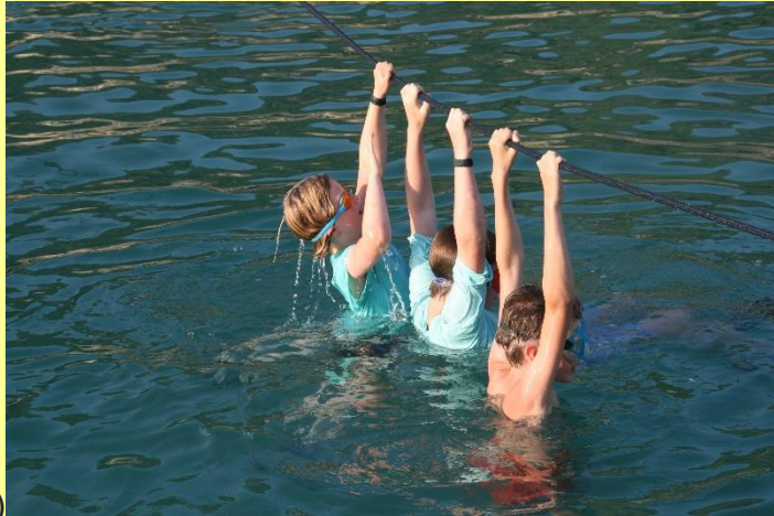
Poros – Perdika (14 zeemijlen)

Het volgende eiland dat we gaan ontdekken heet Aegina. We gaan hier niet in het hoofdplaatsje liggen, maar in een wat kleiner en rustiger dorpje aan de zuidkant: Perdika. Dit is een vissersdorpje waar een klein gedeelte van de haven ook diep genoeg is voor zeiljachten. Goed oppassen bij het aanleggen dus. Eenmaal aan de kade is er in dit dorpje vrij weinig te doen. Daardoor is er juist wel extra veel mogelijkheid om te ontspannen. Doordat de haven vrij open is, plons je zo vanaf je jacht in het frisse water en is de zonsondergang opnieuw adembenemend mooi.