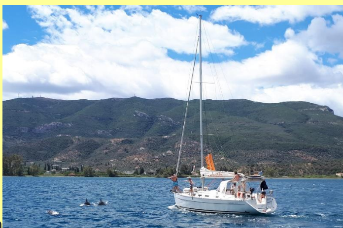
Vathi – Athene (32 zeemijlen)

Nu we twee eilanden en het vasteland al gehad hebben, kiezen we ervoor om vandaag voor een combinatie te gaan. Het dorpje Vathi op het schiereiland Methanon. Dit schiereiland bestaat uit 27 vulkanen en dus gaan we er eentje beklimmen. Aan het eind van de middag, wanneer de ergste hitte voorbij is, brengt een pick-up ons het eerste deel van de berg op. Vervolgens moeten we nog een half uurtje klimmen en wandelen om de top te bereiken. Eenmaal terug in de haven, dineren we in het restaurant direct achter ons jacht, aan een tafel recht voor onze loopplank. In dit dorpje is verder helemaal niks, dus het is heerlijk om na het eten op het voordek nog even van de rust te genieten.