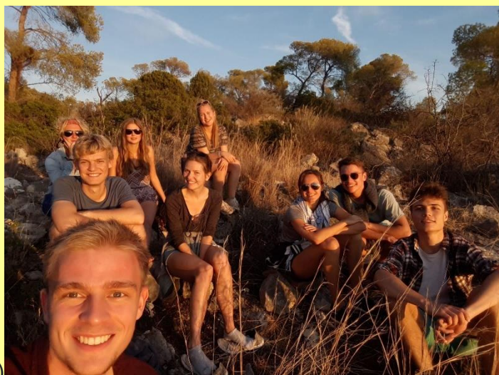
Epidavros – Vathi (10 zeemijlen)

Nu we twee eilanden en het vasteland al gehad hebben, kiezen we ervoor om vandaag voor een combinatie te gaan. Het dorpje Vathi op het schiereiland Methanon. Dit schiereiland bestaat uit 27 vulkanen en dus gaan we er eentje beklimmen. Aan het eind van de middag, wanneer de ergste hitte voorbij is, brengt een pick-up ons het eerste deel van de berg op. Vervolgens moeten we nog een half uurtje klimmen en wandelen om de top te bereiken. Eenmaal terug in de haven, dineren we in het restaurant direct achter ons jacht, aan een tafel recht voor onze loopplank. In dit dorpje is verder helemaal niks, dus het is heerlijk om na het eten op het voordek nog even van de rust te genieten.